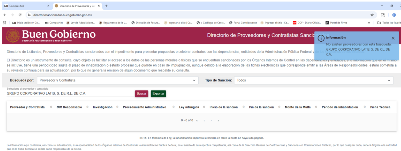
Imagen 2. Pantalla de Directorio de Proveedores y Contratistas Sancionados, búsqueda del licitante GRUPO CORPORATIVO LATIS, S. DE R.L. DE C.V.