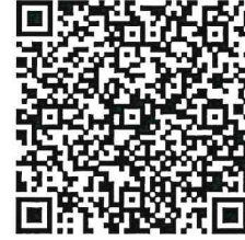
Sello digital del Emisor:

Long alphanumeric string representing the digital seal of the issuer.