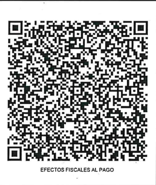
EFFECTOS FISCALES AL PAGO

CFDI RELACIONADOS: ESTE DOCUMENTO ES UNA REPRESENTACION IMPRESA DE UN CFDI TIPO RELACION: - CFDI RELACIONADO: