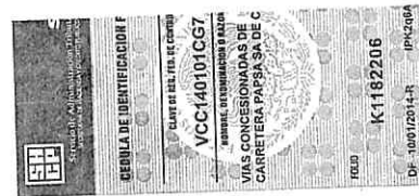
RECIBO DE PAGO No.