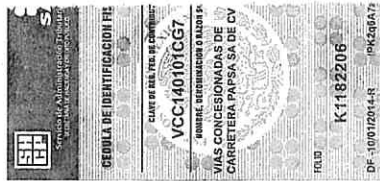
RECIBO DE PAGO No.

Cualquier queja o sugerencia 5813-4397, 58131688 GRACIAS POR SU PREFERENCIA, FELIZ VIAJE