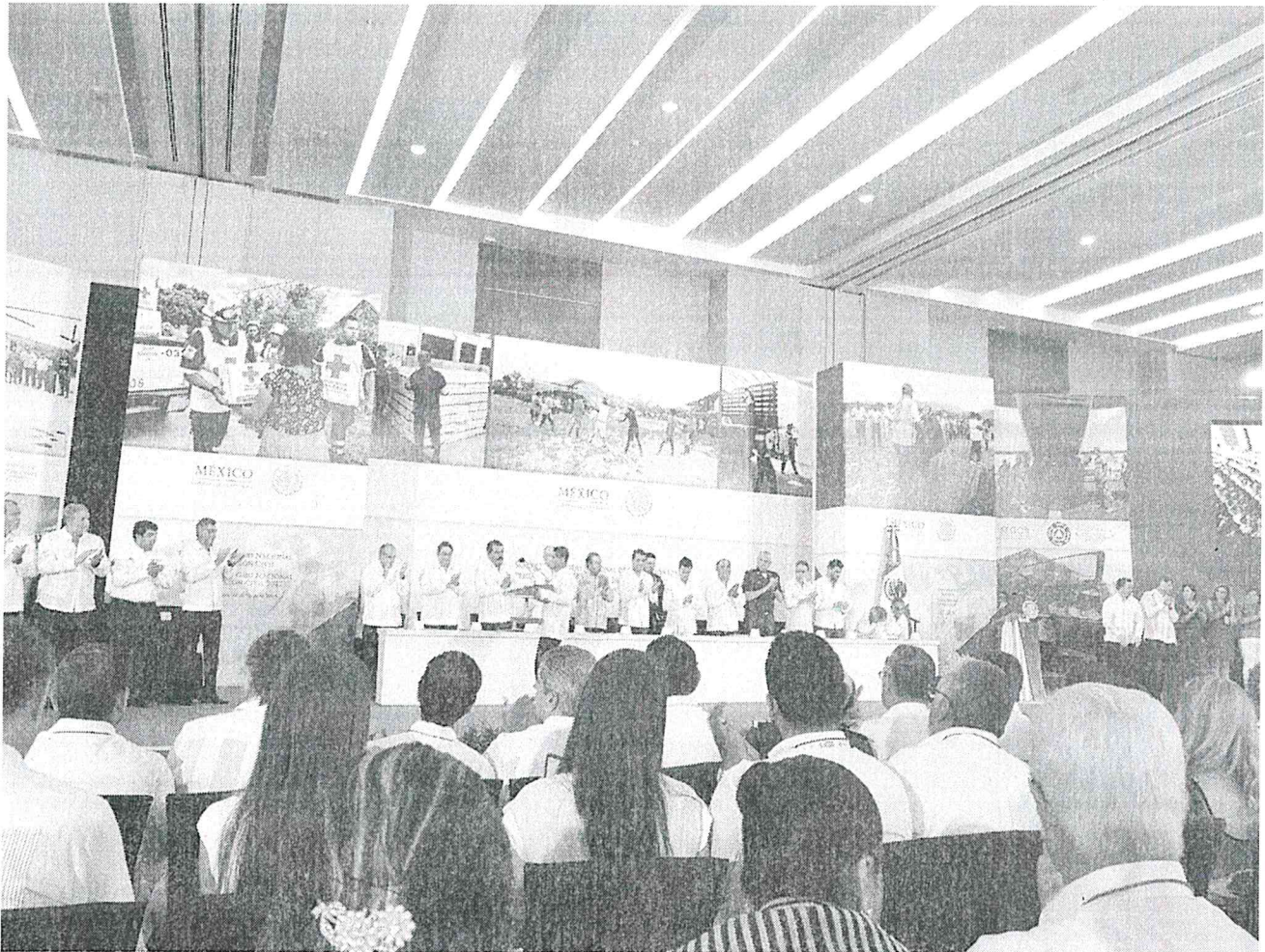
SESIÓN DE PROTECCIÓN CIVIL 2018, CELEBRADO EN EL PUERTO DE ACAPULCO Y EN PRESENCIA DEL PRESIDENTE DE LA REPÚBLICA, LIC. ENRIQUE PEÑA NIETO