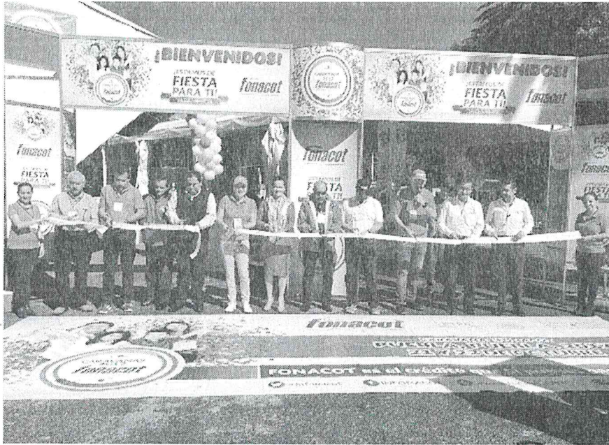
INAUGURACION "CARAVANA FONACOT 2017 PUEBLA" EN EL PASEO BRAVO, PUEBLA.