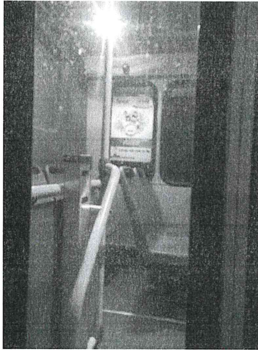
RUTA 72 Y 72-A