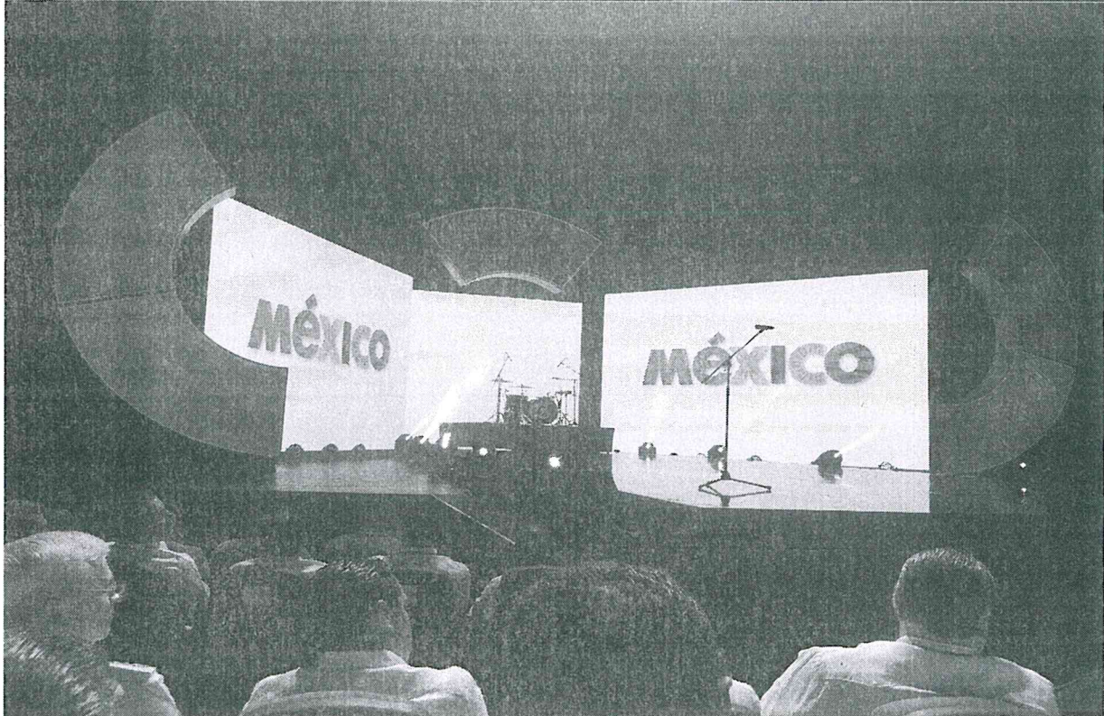
INAUGURACIÓN DEL TIANGUIS TURÍSTICO 2017, EN LA CIUDAD DE ACAPULCO, GUERRERO, POR EL PRESIDENTE DE LA REPÚBLICA, LIC. ENRIQUE PEÑA NIETO.