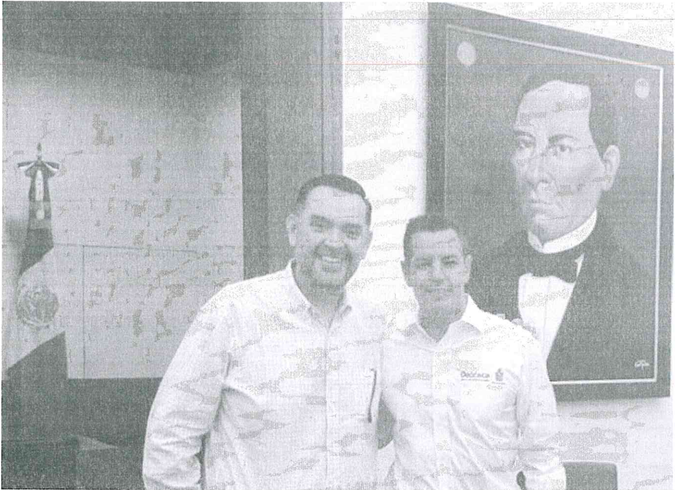
MTRO. ALEJANDRO MURAT HINOJOSA, GOBERNADOR CONSTITUCIONAL DEL ESTADO DE OAXACA

amable nos agradeció el esfuerzo para llevar a cabo la firma con el Instituto FONACOT. -Gran avance para el logro de la firma del convenio de COLABORACION Y DIFUSIÓN Gobernador y DG - se logró dar un gran avance con las áreas tanto de logística del Gobernador, cómo de las jurídicas del propio Gobierno. -De gran importancia el acercamiento con el nuevo Delegado de STPS