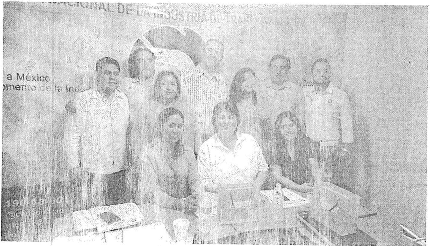
REUNIÓN CON JUNTA DIRECTIVA Y SU PRESIDENTE "CANACINTRA ACAPULCO"